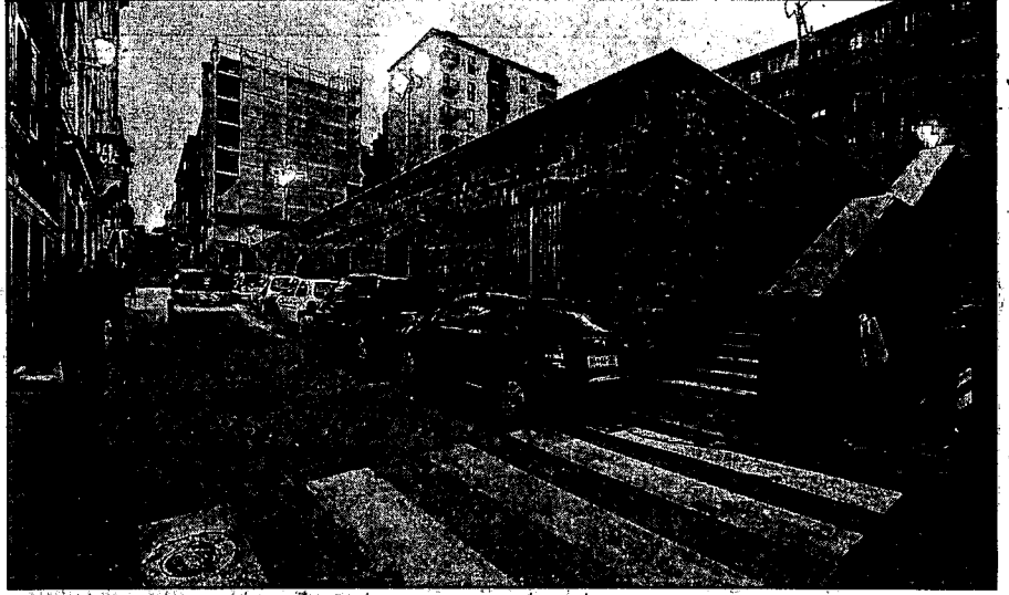
Gli accessi al seminterrato della piazza lungo via della Guardia

C'è chi invoca le telecamere e perfino le ronde, ma per vigilare il territorio alle volte basta semplicemente viverlo. Favorendo la fruizione di piazze e giardini alla cittadinanza, mattina e sera, non lasciando quegli spazi nelle mani dei malintenzionati. E quello che sta accadendo nella riqualificata piazza Puecher che, dopo il ritorno del mercatino e la promozione di manifestazioni organizzate in superficie, si appresta a far rinascere anche i locali del seminterrato.